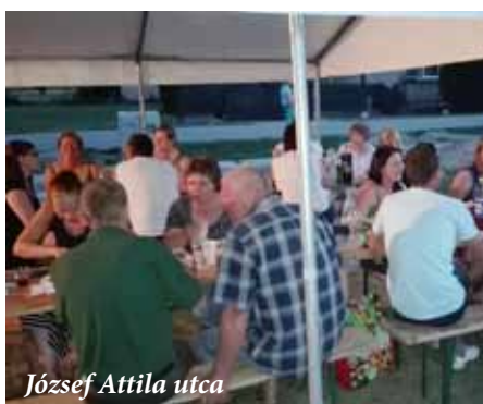
József Attila utca

Dunakilitin már nagy hagyománya van az utcabáloknak. Mi sem bizonyítja ezt jobban, hogy a Sallai utcában a 10. évfordulót ünnepelték! Az egymás mellett élők kölcsönös tiszteletének, közösségek összetartásának szép példái ezek a rendezvények.